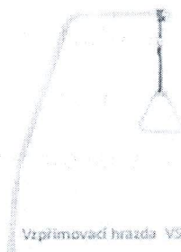
Vzprímovač hrazda VS390